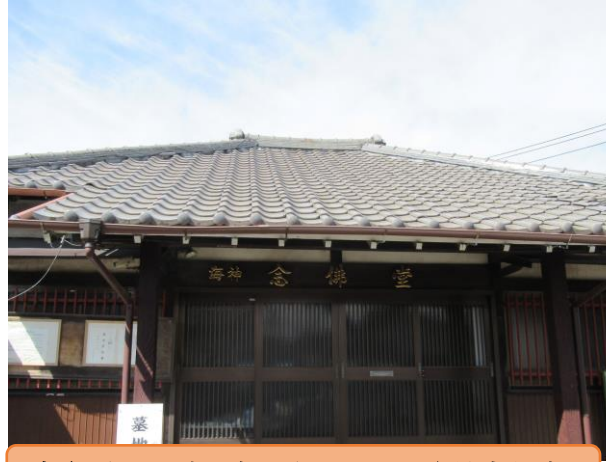
市有形文化財が安置されている海神念仏堂

元禄年間(1700)前後(第五代将軍、徳川綱吉の時代)に芝増上寺の住持(寺の代表僧)となった祐天上人の教化により、浄土宗の寺院の形を整え、念仏堂の名の通り常念仏の修行が行われ、また信者が集まって念仏を唱えていたといわれています。