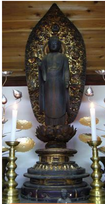
木造 阿弥陀如来立像 (写真 市HPより)

縁起によればこの仏像は、俵藤太藤原秀郷の造立と伝えられ、近くにあった善光寺の本尊であったが廃寺となり、松戸市の浄土宗東漸寺に移されたものを、江戸神田鍋町の商人高麗屋佐治右衛門が、元禄14年(1701)に亡くなった父の菩薩を弔うため、この堂に納めたといわれています。