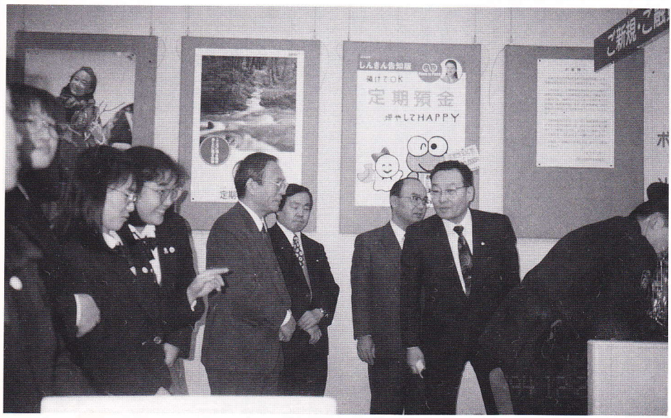
江戸川信用金庫 東大島支店 平成六年十二月二十日