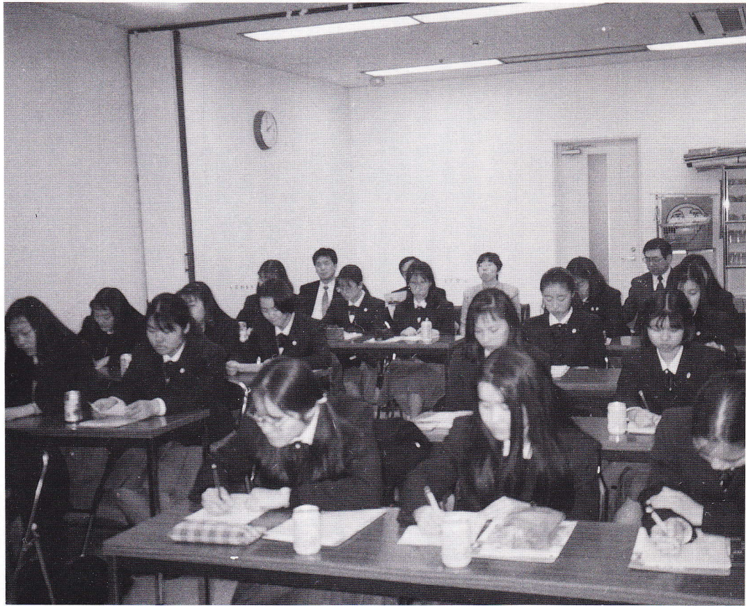
職場見学と説明会 (平成6年12月20日)