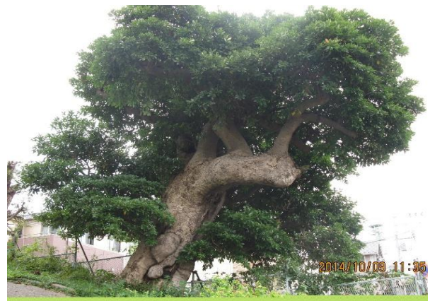
幹周り4.9m、枝が折れている