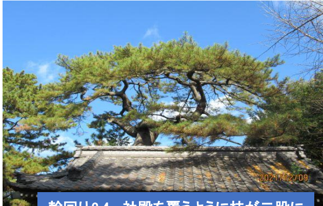
幹回り3.4m 社殿を覆うように枝が二股に