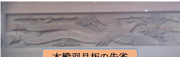
本殿羽目板の朱雀