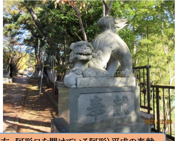
一の鳥居の狛犬(左 口を閉じている吽形・右 阿形口を開けている阿形)平成の奉獻