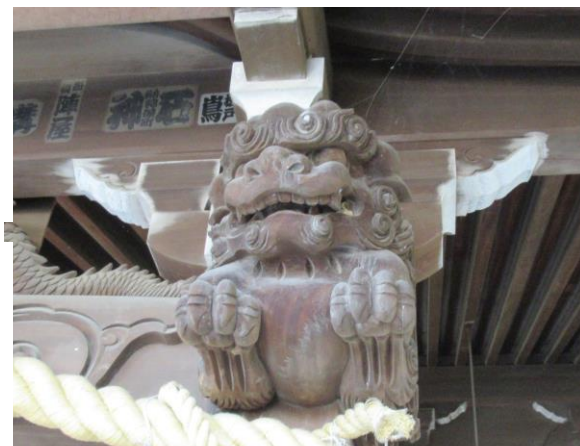
向拝の屋根を支える柱の先端の獅子頭