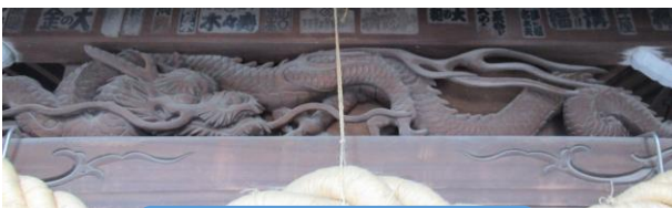
拝殿向拝の見事な龍