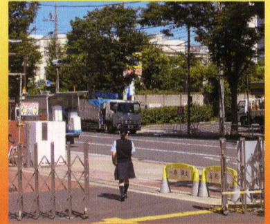
試験に向かう3年生

受験生は、試験直前まで面接練習や作文練習を繰り返し行っています。これまで勉強・練習してきたことを十分に発揮し、自信を持って試験に臨んでください。