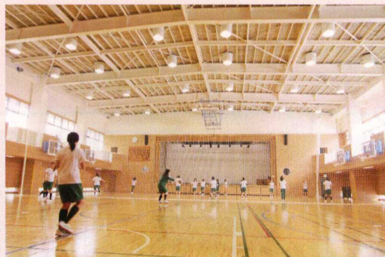
久しぶりの体育館で行う授業

また、体育館の内部は床、壁面、天井、照明等の施設が一新され、どこもピカピカに光っています。生徒たちも、新しくなった体育館で汗を流すことを楽しみにしています。これで三商のスポーツが盛んになることは間違いありません。あとは、来年3月の校舎棟とプール棟の改修工事の完了と、新しい実習棟の完成を待つだけです。