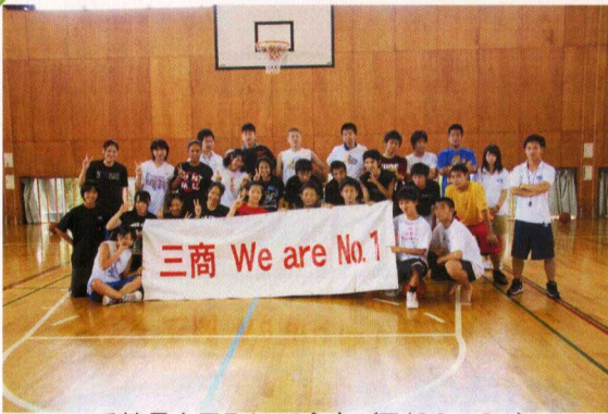
千葉県白子町にて合宿(7/28~31)