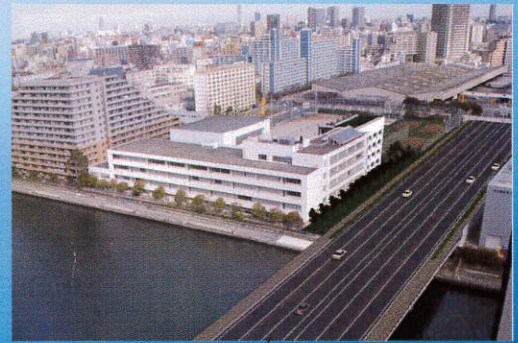
竣工予想図（平成26年4月）

昨年の9月に始まった校舎の改築・改修工事は順調に進み、まず体育館の工事が8月中に終了し、2学期から使用できるようになりました。また、校舎棟、実習棟、プール棟については、来年3月に工事が終了する予定です。第三商業高校としては、実に32年ぶりの大工事が間もなく終わろうとしています。創立86年の歴史に新しいページが始まるとともに、何よりも来年4月に入学する新入生の皆さんには、真新しい校舎での高校生活が待っています。