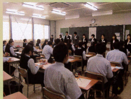
卒業生からの講話(就職会場)

各会場(就職・大学・短大・専門学校)に分かれて、就職会場では、卒業生から受験する上での心構え、会社の事業内容、各自の仕事内容について、大学・専門学校会場では、各学校の講師の方々から学校概要や入試方法などについてお話をいただきました。懇談会に御協力いただきました講師の皆様、卒業生の皆様、ありがとうございました。