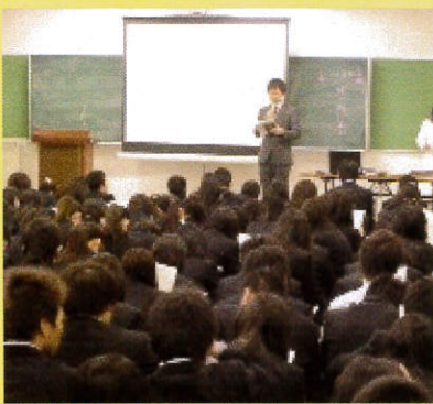
オリエンテーションの様子

本校では、商業教育やキャリア教育の一環として、2学年の全生徒を対象としたインターンシップを2月に実施しています。インターンシップでは、地域と連携し地元企業や進路先の協力を得て就業体験活動を行います。