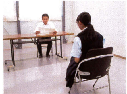
校内での面接練習

これまで勉強・練習してきたことを十分に発揮し、自信を持って試験に臨んでください。