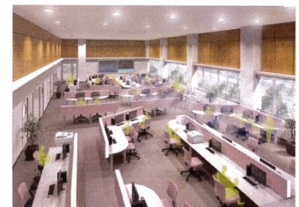
総合実践室（完成予想図）